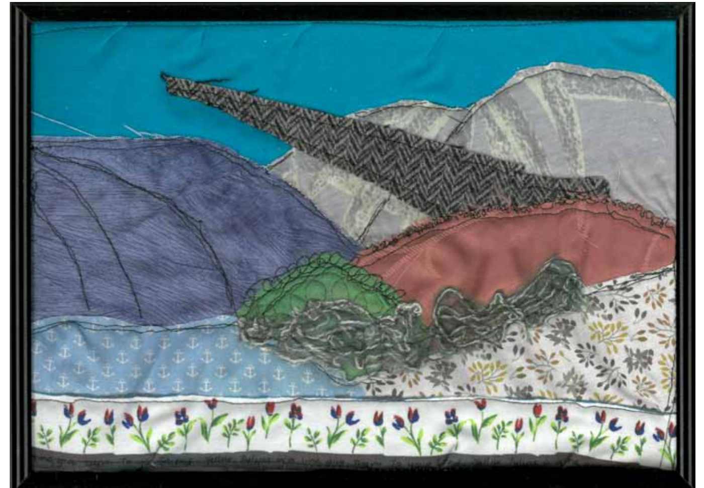
„Lausitz – gestern, heute, morgen“, 30 x 21 cm, Applikation