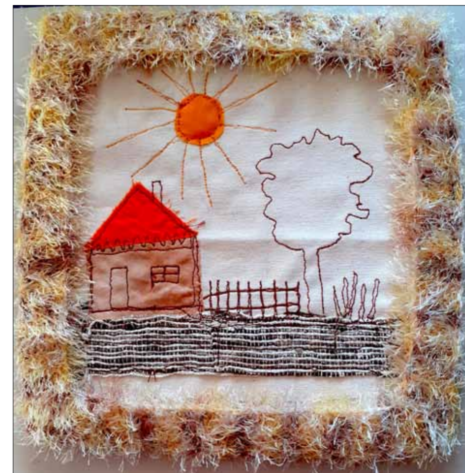
Workshop BLMK 2022, erste Versuche, auf Pappe gezogen und Rahmen gehäkelt