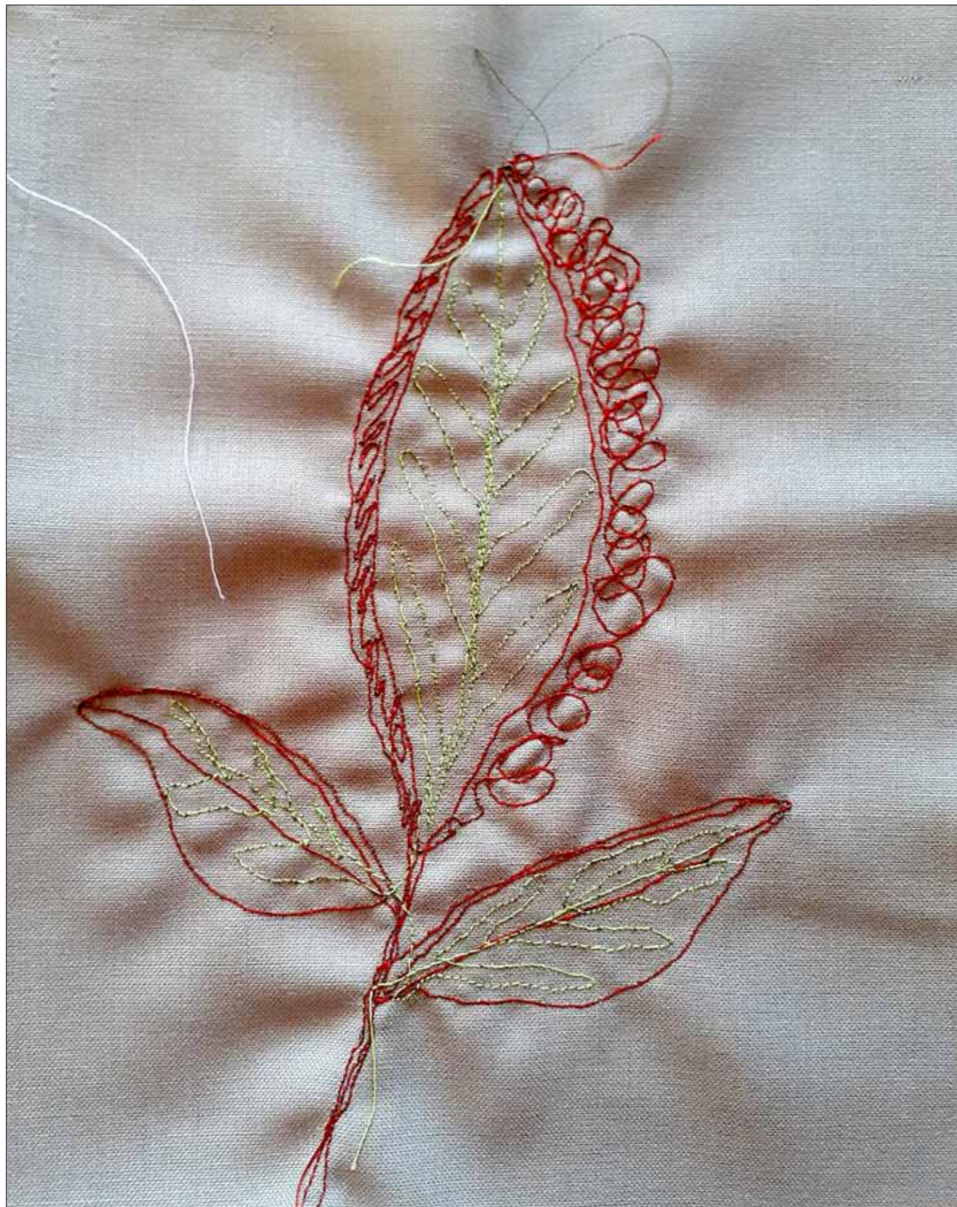
Workshop BLMK 2022, erste Versuche