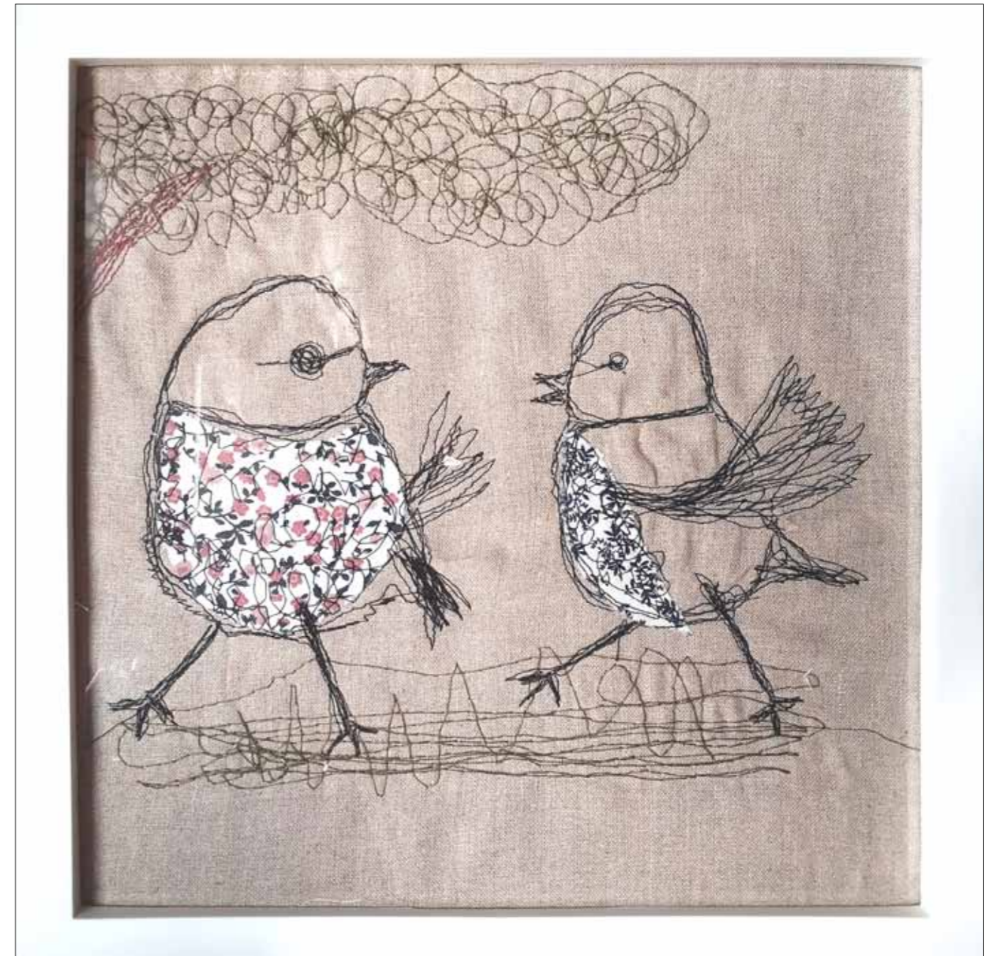
„Ich habe ein Futterhaus entdeckt!“ – „Warte, ich komm mit!“ 26 x 26 cm