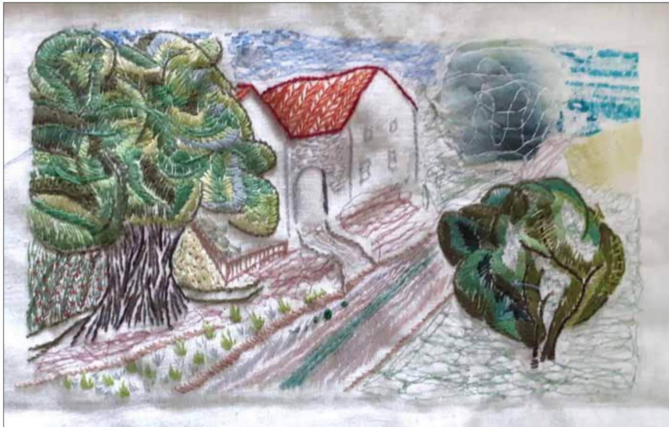
Ruben Ausbau, Mischtechnik (gestickt, genäht, appliziert)