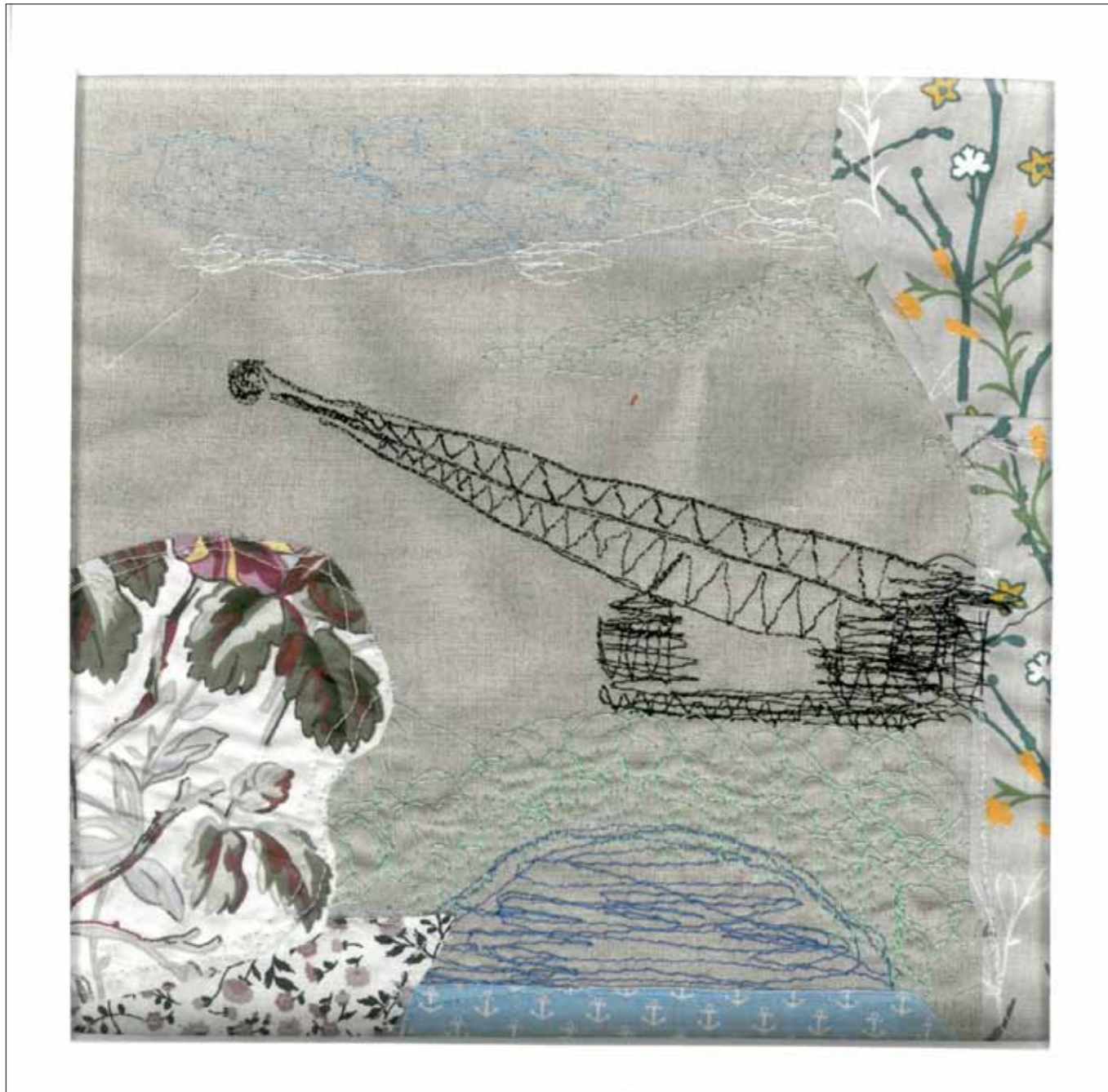
„Am Bergheider See“ 26 x 26 cm, Nadel mit Applikationen