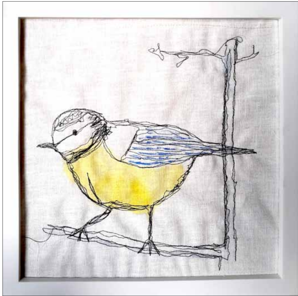
beide 26 x 26 cm