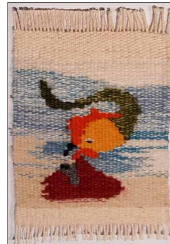
Workshop „Bildwirkerei“ am BLMK, November 2022 „Der gute Drache Plon“ 10 x 12 cm